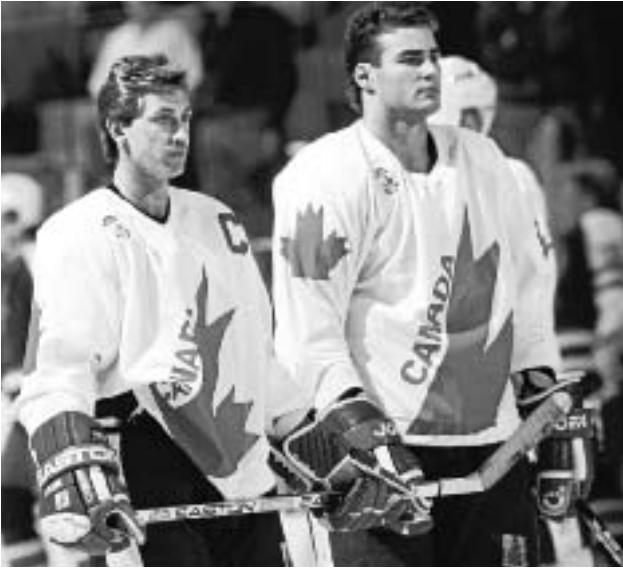
WAYNE GRETZKY JA ERIC LINDROS KÄVIVÄT SAMAN KOULUN: KANADAN JUNIORISARJAN.

säkin kaupungeissa pelaavat joukkueet, kuten esimerkiksi Kamloops (asukasluku 77,000, joukkue Blazers) ja Red Deer (asukasluku 68000, joukkue Rebels) keräävät otteluihinsa keskimäärin noin 5300 henkeä. (ks. taulukko yllä).